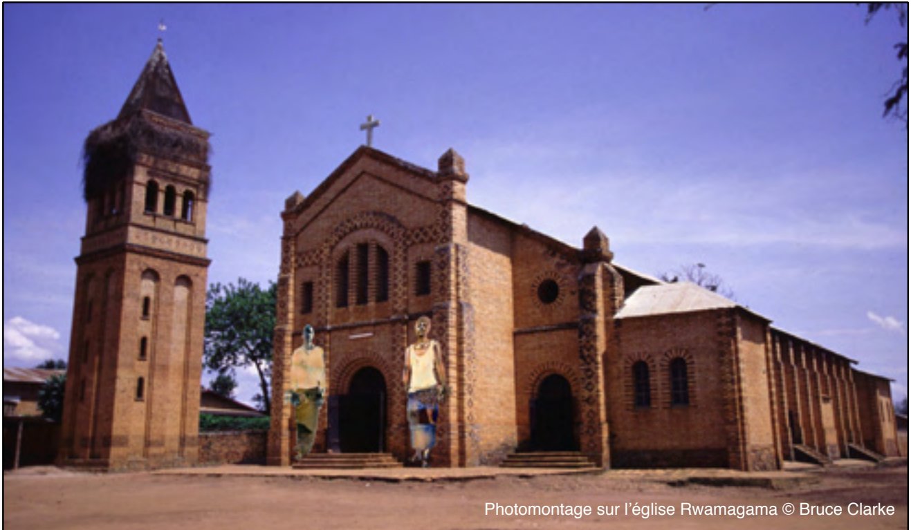
Photomontage sur l'église Rwamagama © Bruce Clarke