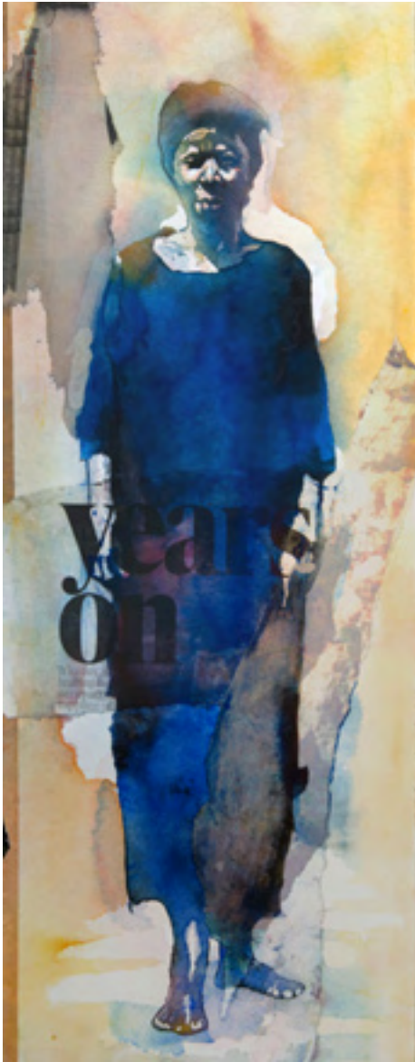
«Years on», collage et aquarelle, © B. Clarke