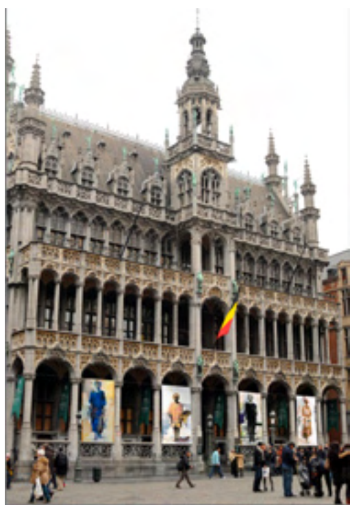
Photomontages sur la Grand Place de Bruxelles à gauche