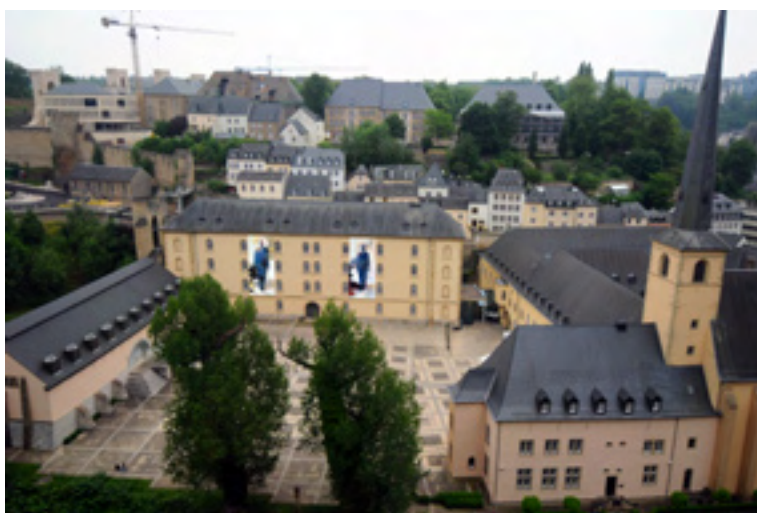
ci-dessous, sur l'abbaye de Neumünster, Luxembourg © Bruce Clarke